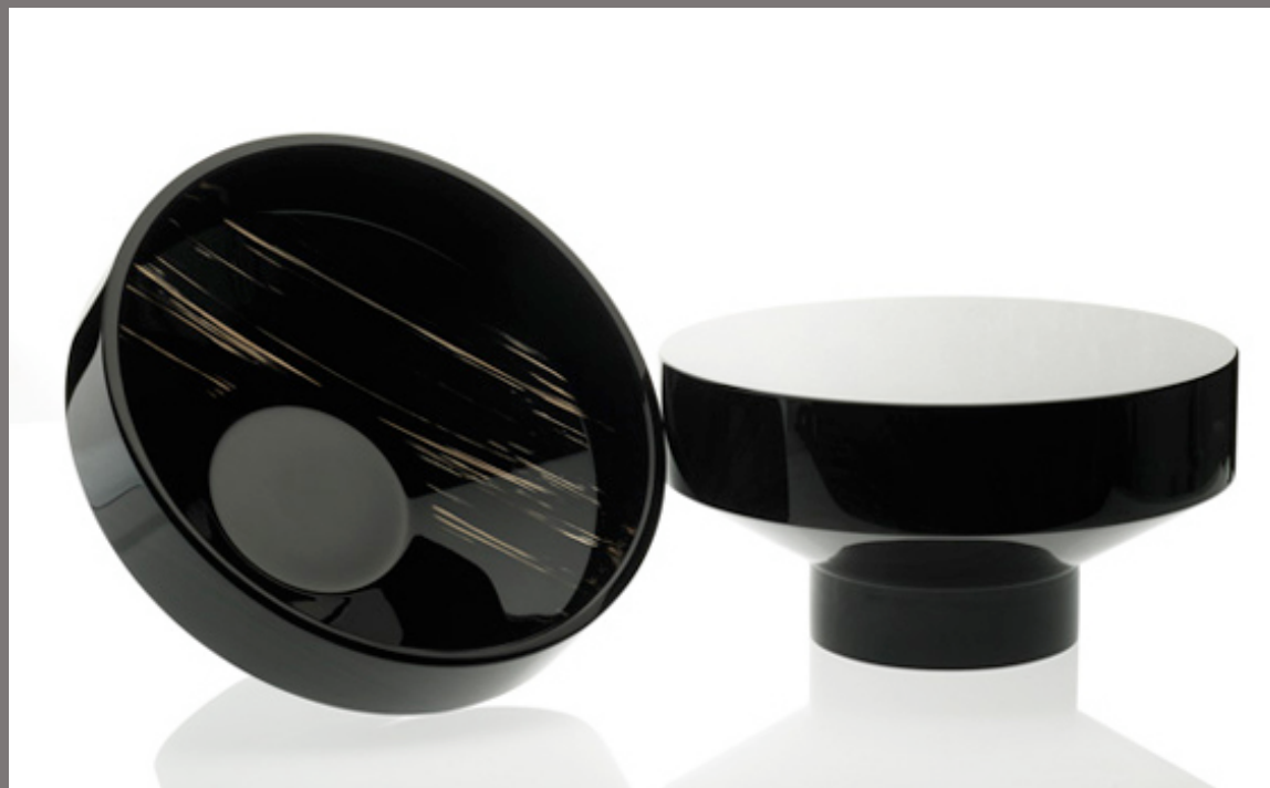
Arik LEVY « Absence » Obsidienne h. 3,5 cm x d. 27 cm